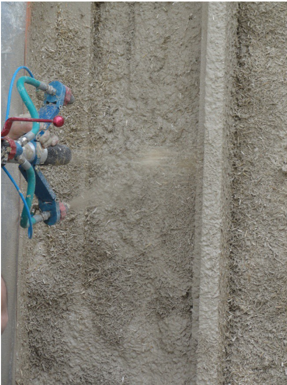
- Auberge de Signy-L'abbaye -

Démonstration d'utilisation du béton de Chanvre en projection pour isolation de murs extérieurs (27 avril 2016)