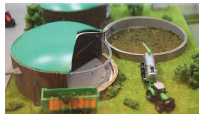
Représentation en coupe d'une unité de méthanisation