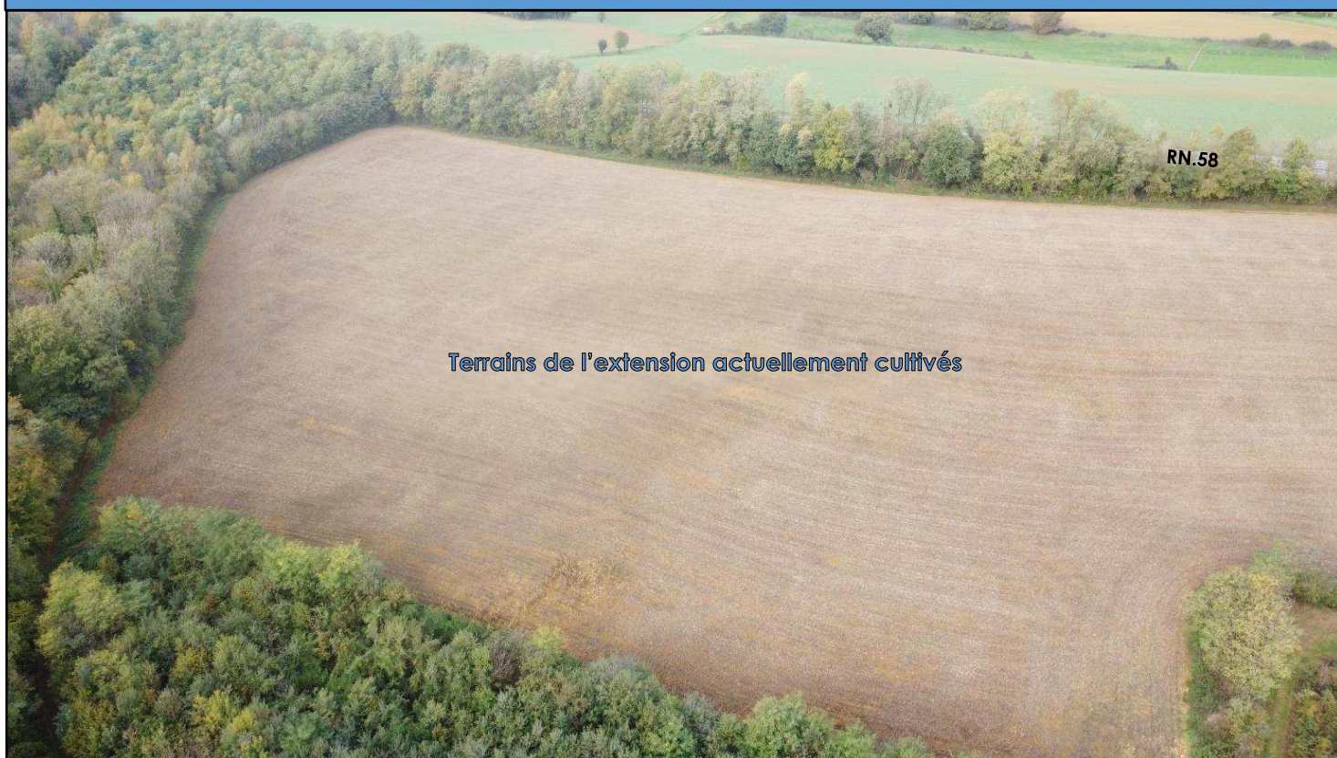
Photo 2 prise par drone le 28/10/2022