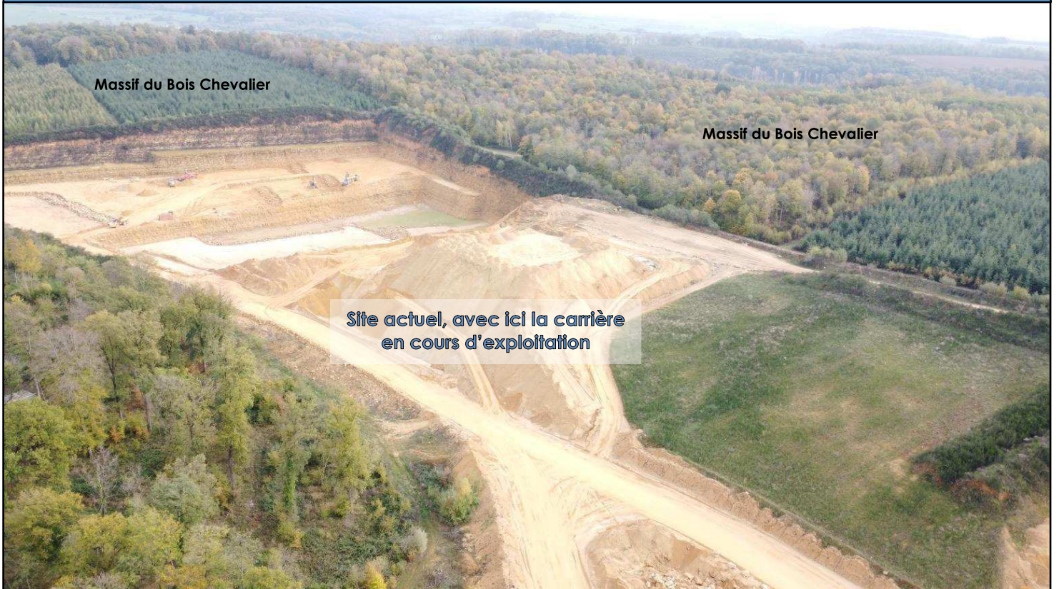
Photo 6 prise par drone le 28/10/2022