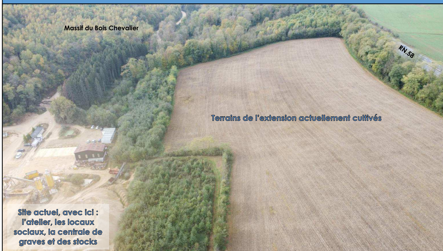
Photo 4 prise par drone le 28/10/2022